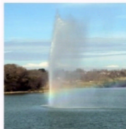
Le jet d'eau